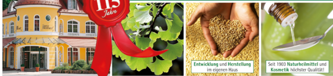
Entwicklung und Herstellung im eigenen Haus