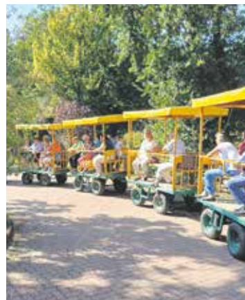
Mit der Minibahn ging es durch die Heidelbeerplantage.

Am 9. September fand die erste Mitgliederversammlung nach der Sommerpause statt,