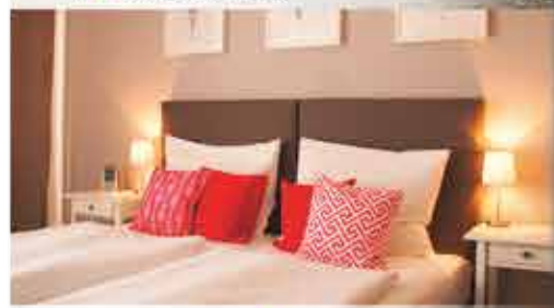
Zimmerbeispiel, 3+ Hotel Dein Franz