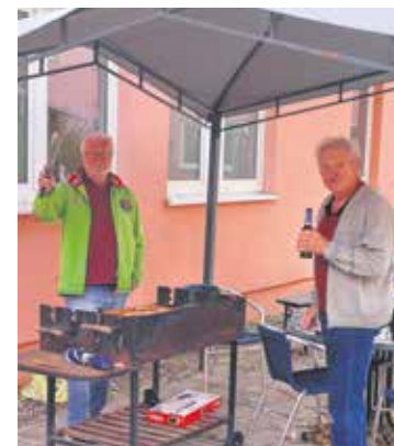
Kein Sommerfest ohne Grillen.