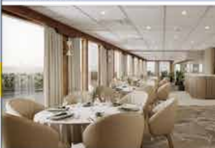
Restaurant, 4+ DCS Amethyst 1