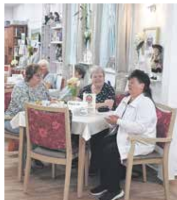
Themenfindung auf der Mitgliederversammlung.

Als langjähriges Mitglied im „Haus der Begegnung“ profitiert der Kreisverband von vielen Annehmlichkeiten, wie zum Beispiel die kostenlose Nutzung der barrierefreien Räume und Innenhöfe für verschiedene Veranstaltungen. Dafür ein großes Dankeschön an das „Haus der Begegnung“!