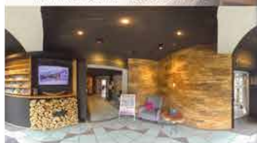
Eingangsbereich, 3+ Hotel Dein Franz