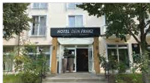
3+ Hotel Dein Franz

Freizeit/Kur/Unterhaltung: Die hauseigene Physiotherapiepraxis bietet Ihnen gegen Aufpreis erholsame und wohltuende Anwendungen. Oder Sie nutzen den Fahrradverleih (gg. Gebühr) im Hotel, um das herrliche Rottaler Bäderdreieck aktiv zu erkunden.