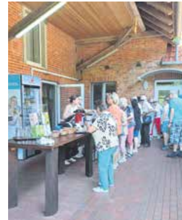
Vor dem Hofladen gab es ein Kuchenbüfett.