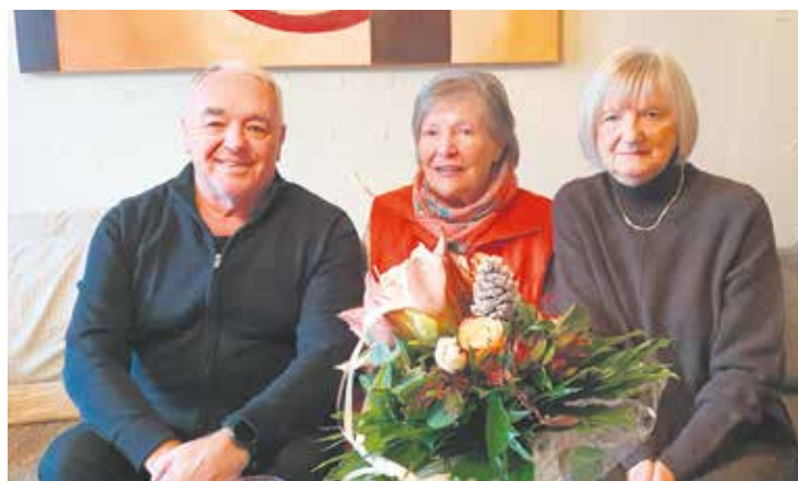
Ortsverband Hüttigweiler-Spiesen-Ottweiler 1