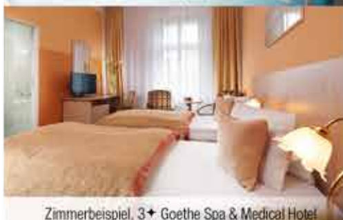
Zimmerbeispiel, 3+ Goethe Spa & Medical Hotel