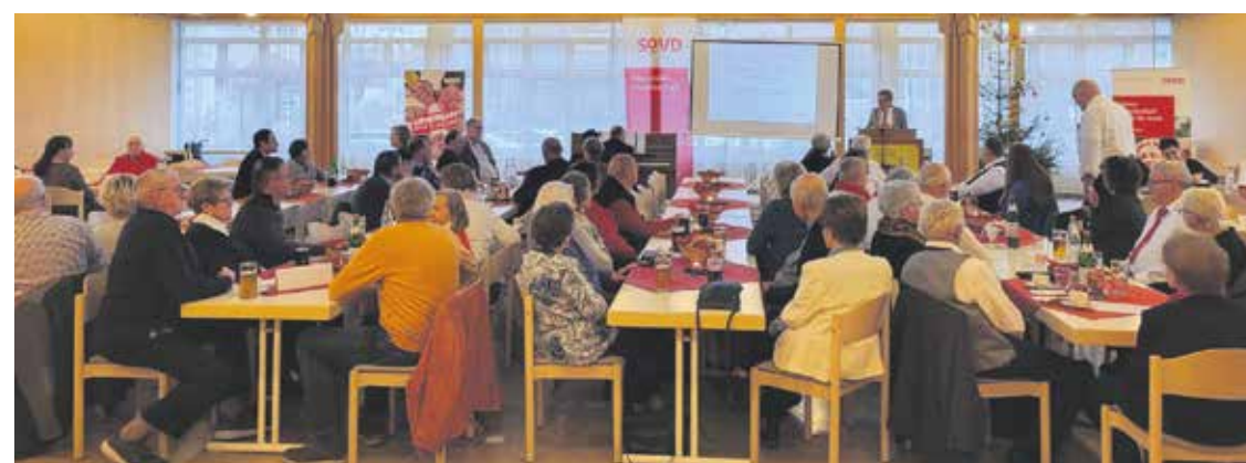
Die Podiumsdiskussion widmete sich einem hochaktuellen Thema und stieß auf großes Interesse.