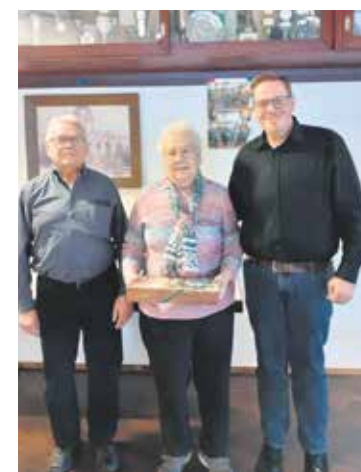
Ortsverband Steinweiler 2

24 Jahren als Frauensprecherin aus gesundheitlichen Gründen aus dem Kreisvorstand aus.