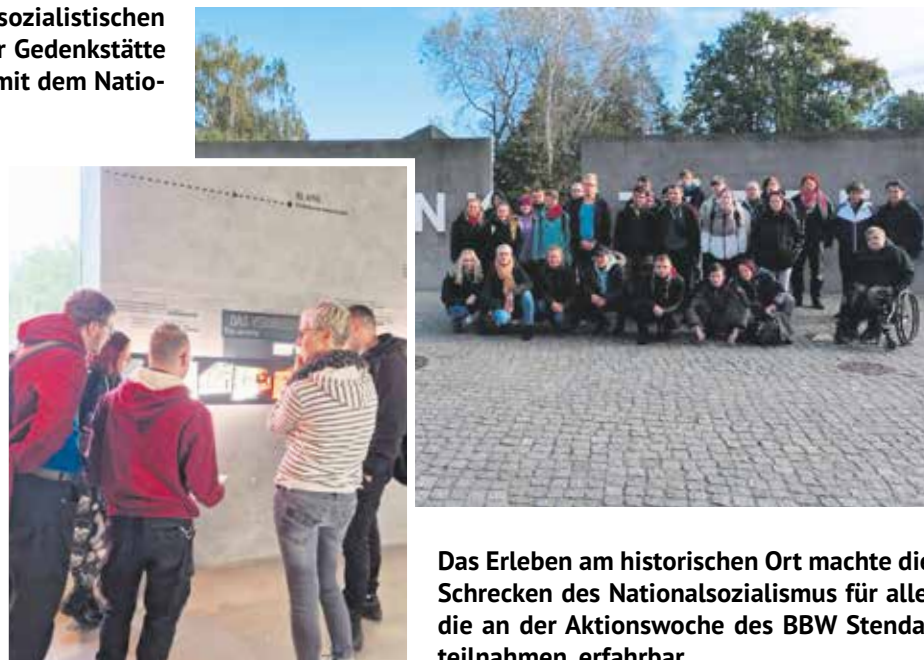
Das Erleben am historischen Ort machte die Schrecken des Nationalsozialismus für alle, die an der Aktionswoche des BBW Stendal teilnahmen, erfahrbar.

Die Collagen sind in der Mensa des BBW ausgestellt und vermitteln einen Eindruck von der Woche.