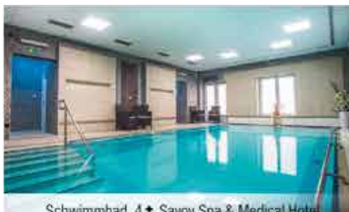
Schwimmbad, 4+ Savoy Spa & Medical Hotel

Freizeit/Kur/Unterhaltung: Entspannte Stunden können Sie als Gast des Hotels Goethe in der hoteleigenen Infrasauna verbringen. Den Gästen vom Hotel Savoy steht ein Rehabilitations-Bassin (8 x 5 m, ca. 30°C) und eine finnische Sauna zur freien Verfügung.